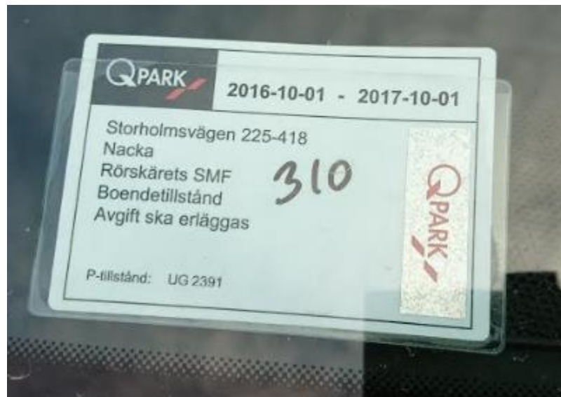
Exempel på boendeparkeringstillstånd

Mer information om var och när tillstånden kan kvitteras ut kommer inom kort.